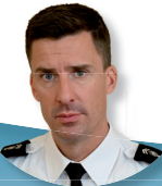
Commandant du groupement de gendarmerie départementale Colonel Aurélien Ardillier

Sécurité des personnes, des biens et des institutions, lutte contre la délinquance, lutte contre les violences urbaines et l'insécurité routière